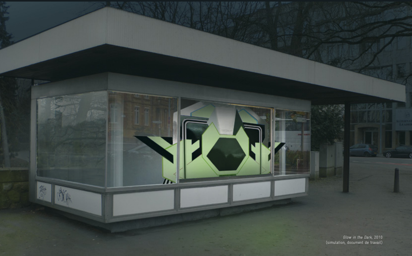
Glow in the Dark, 2010 (simulation, document de travail)