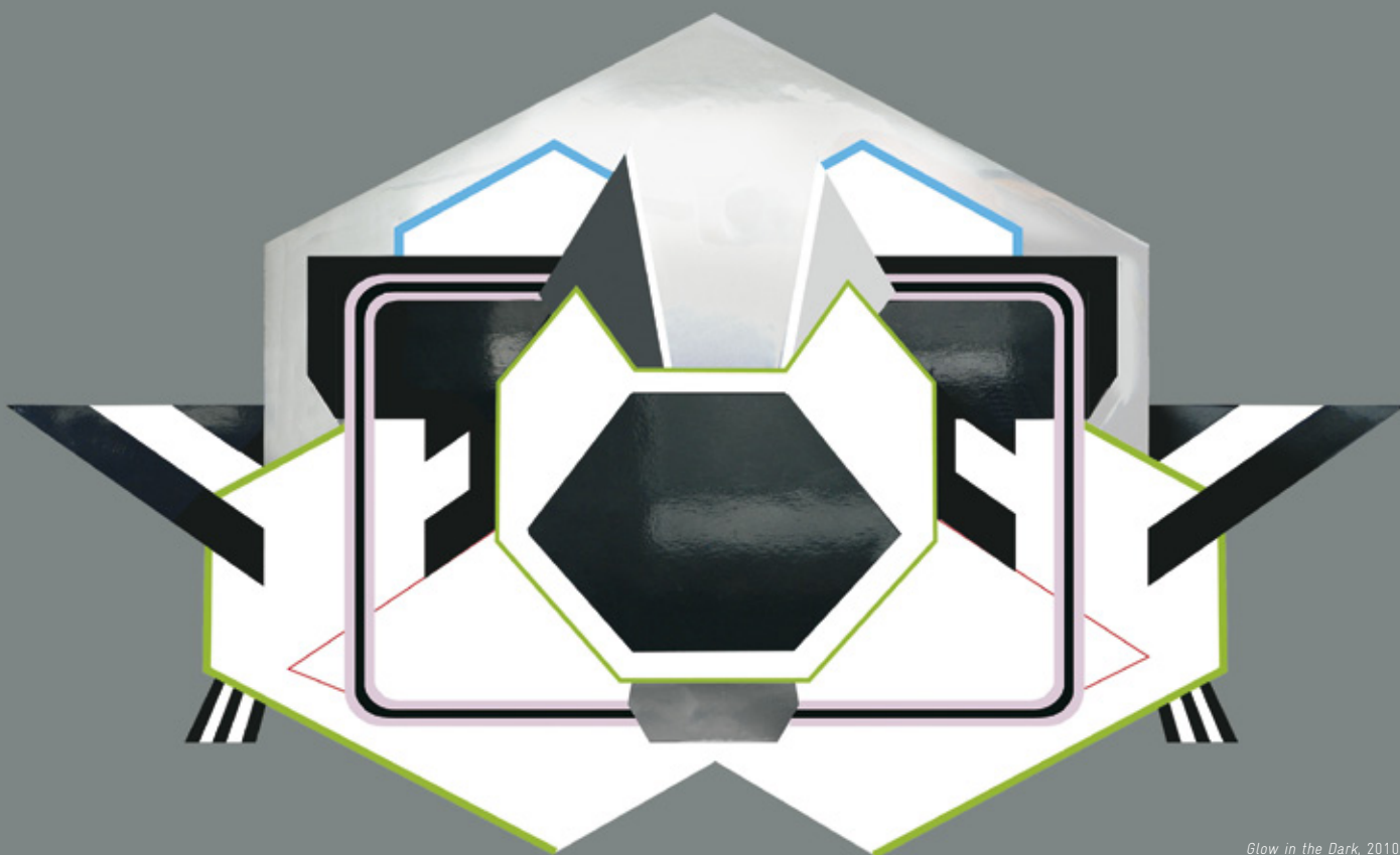
Glow in the Dark , 2010 (simulation, document de travail)